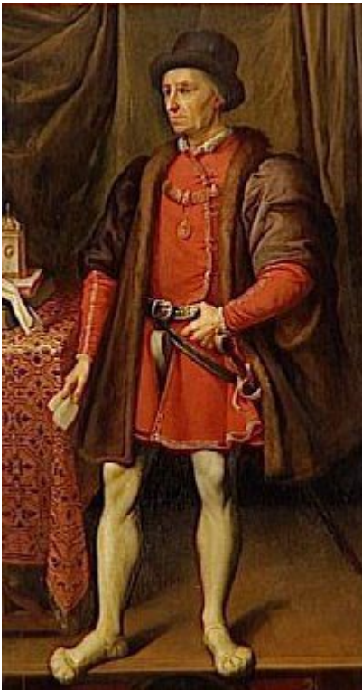
São Luís de França

– É um compromisso com a consciência má.